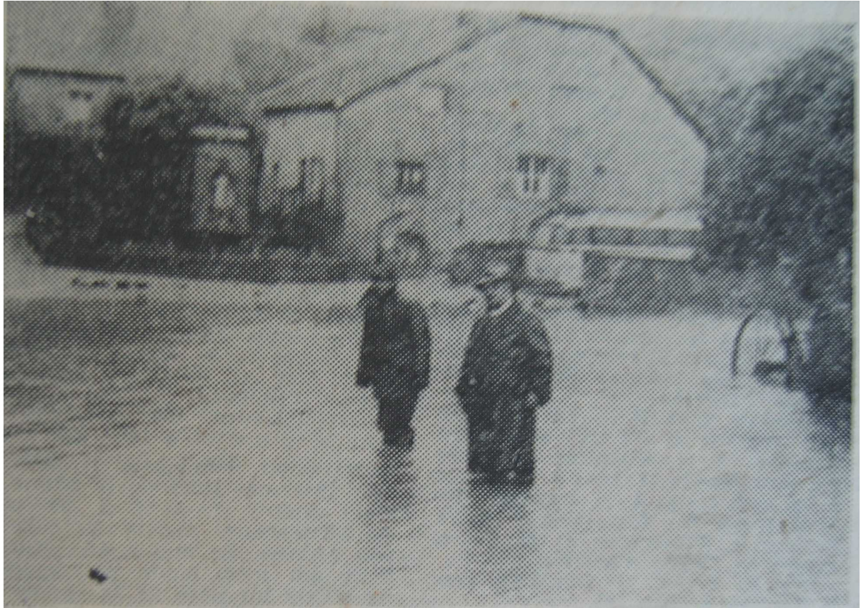
Rougemont (Doubs), l'eau envahit le quartier de Rougemontot