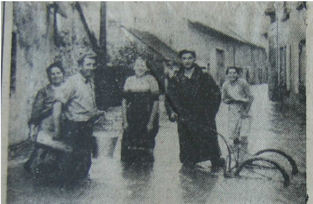
Ci-dessus : La rue des Juifs à Rougemont (Doubs) et un groupe d'habitants dans l'eau.

D'autre part, notons la bonne tenue de tous les habitants et la prompte décision de l'équipe Cochery, en stationnement à Rougemont, sous la conduite de son chef qui surent participer avec ardeur et intelligence, à apporter le secours nécessaire à la population.