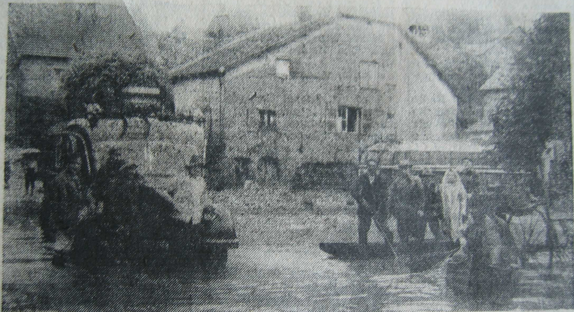
Pompiers et sauveteurs pendant l'inondation. On remarque le car des Monts-Jura immobilisé