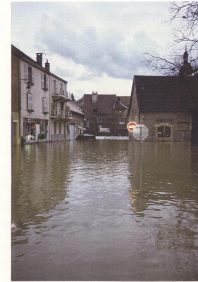
ORNANS - 1991