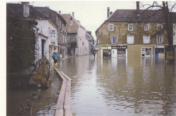
ORNANS - 1991