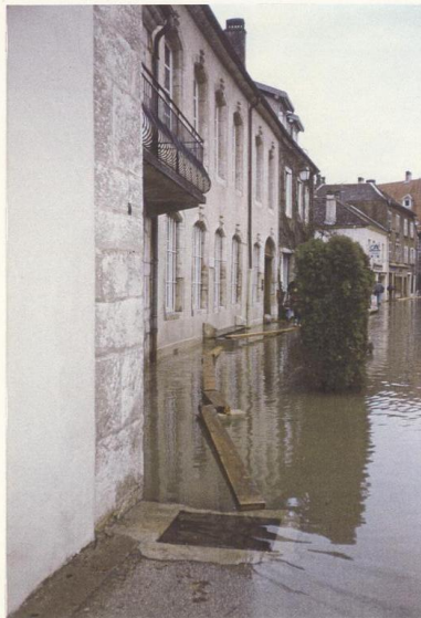
ORNANS - 1991