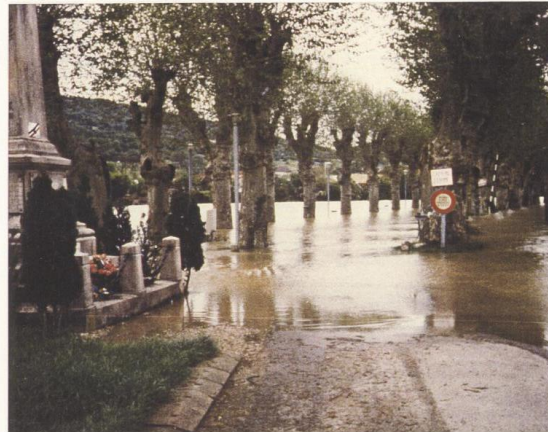
QUINGEY - 1983