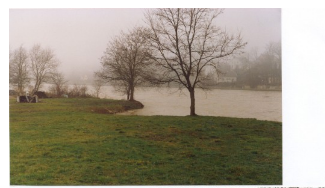
les inxondations brues des brueaux de la Navigation