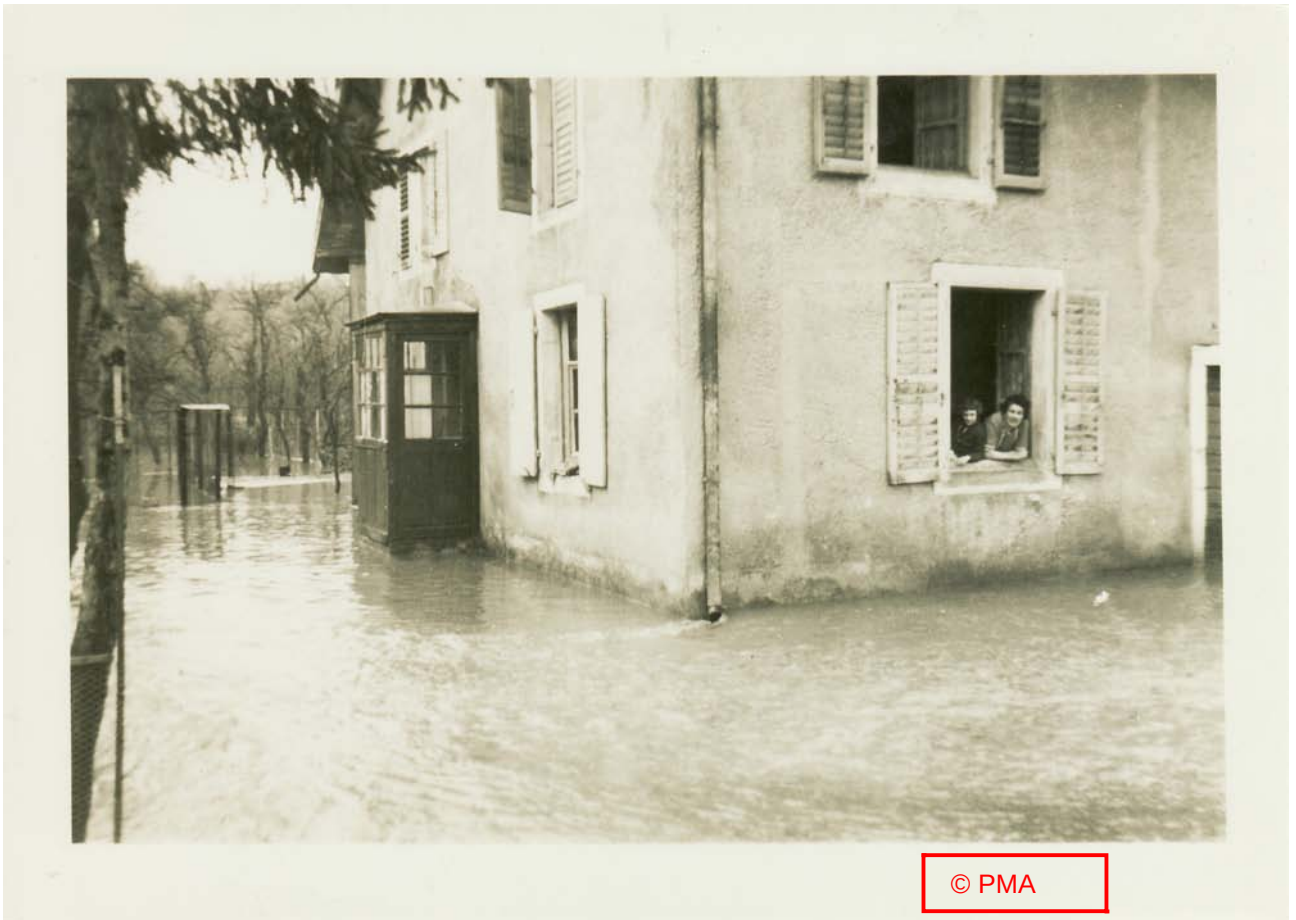
« Rue des Gravieres »