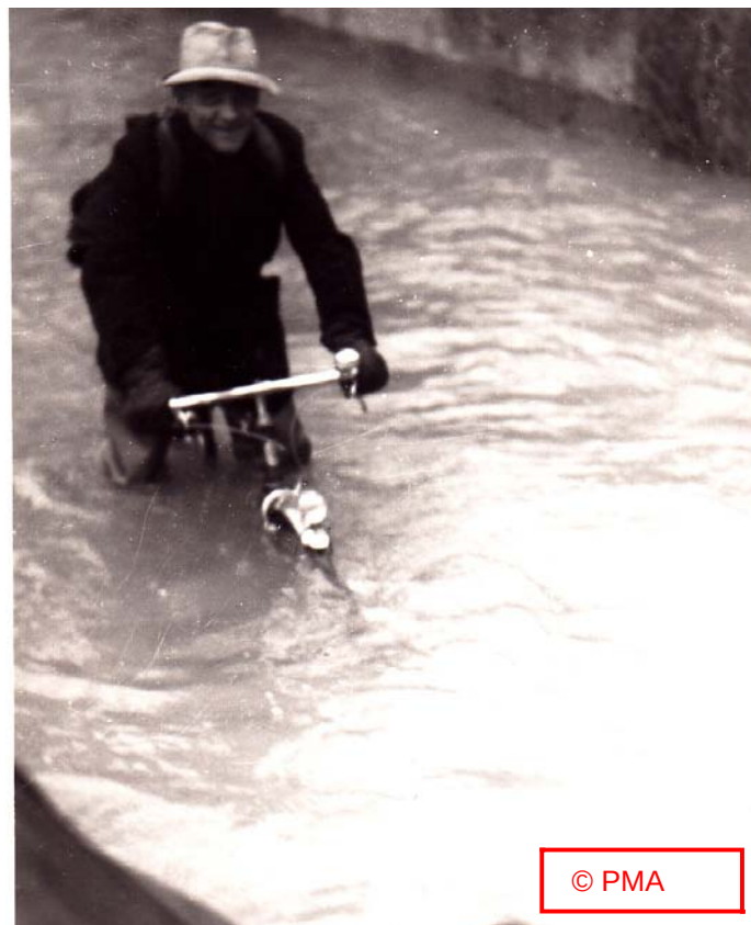
« Rue des Graviers »