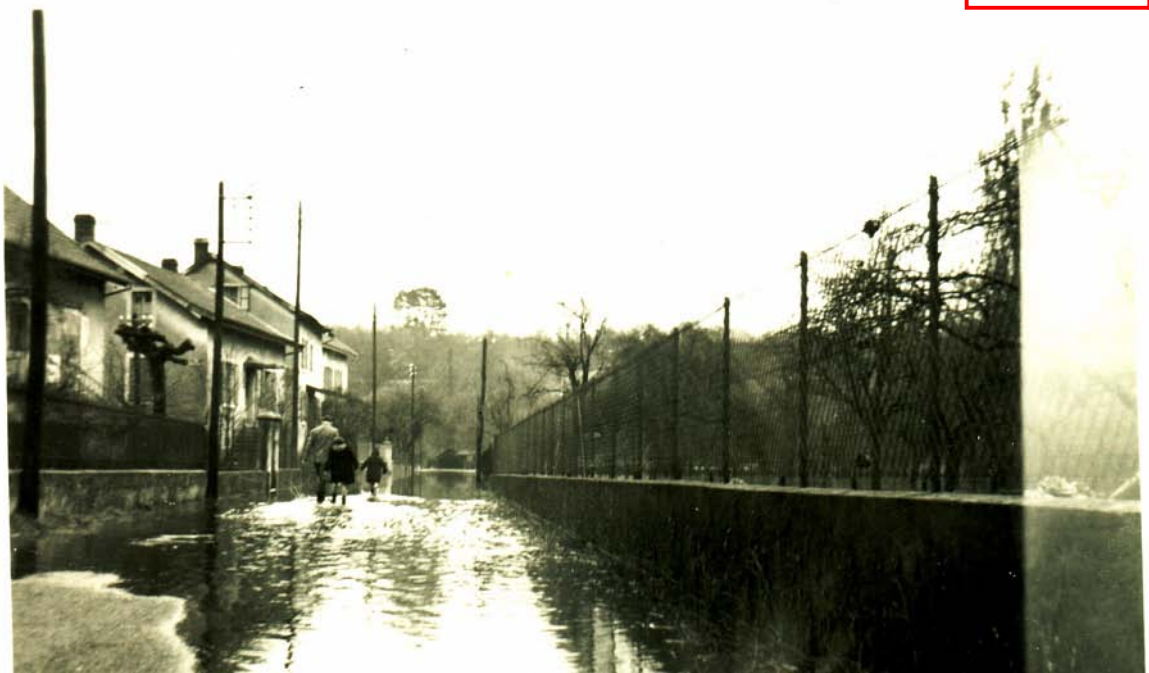
« Rue Neuve »