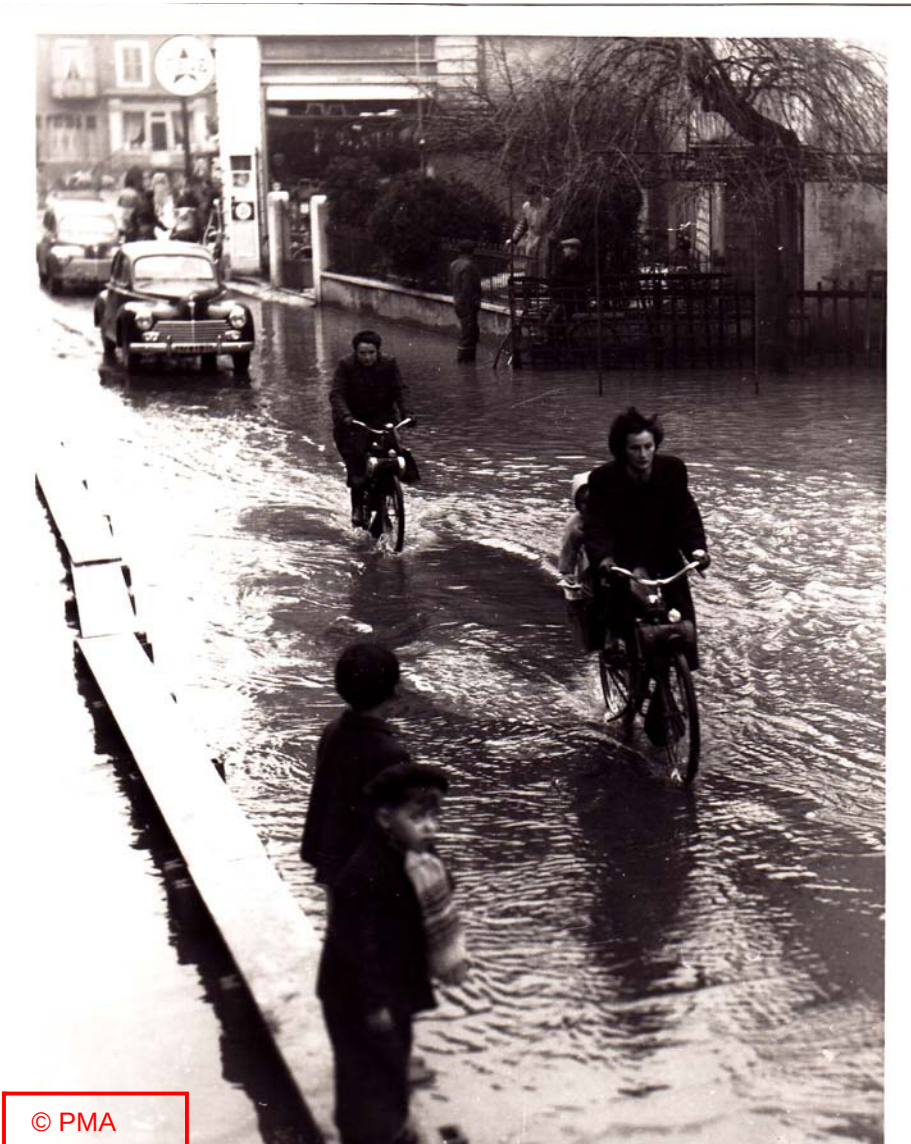
« Rue Villedieu »