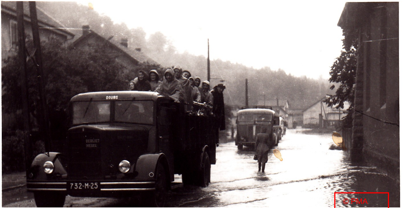
« Cités Blanches »