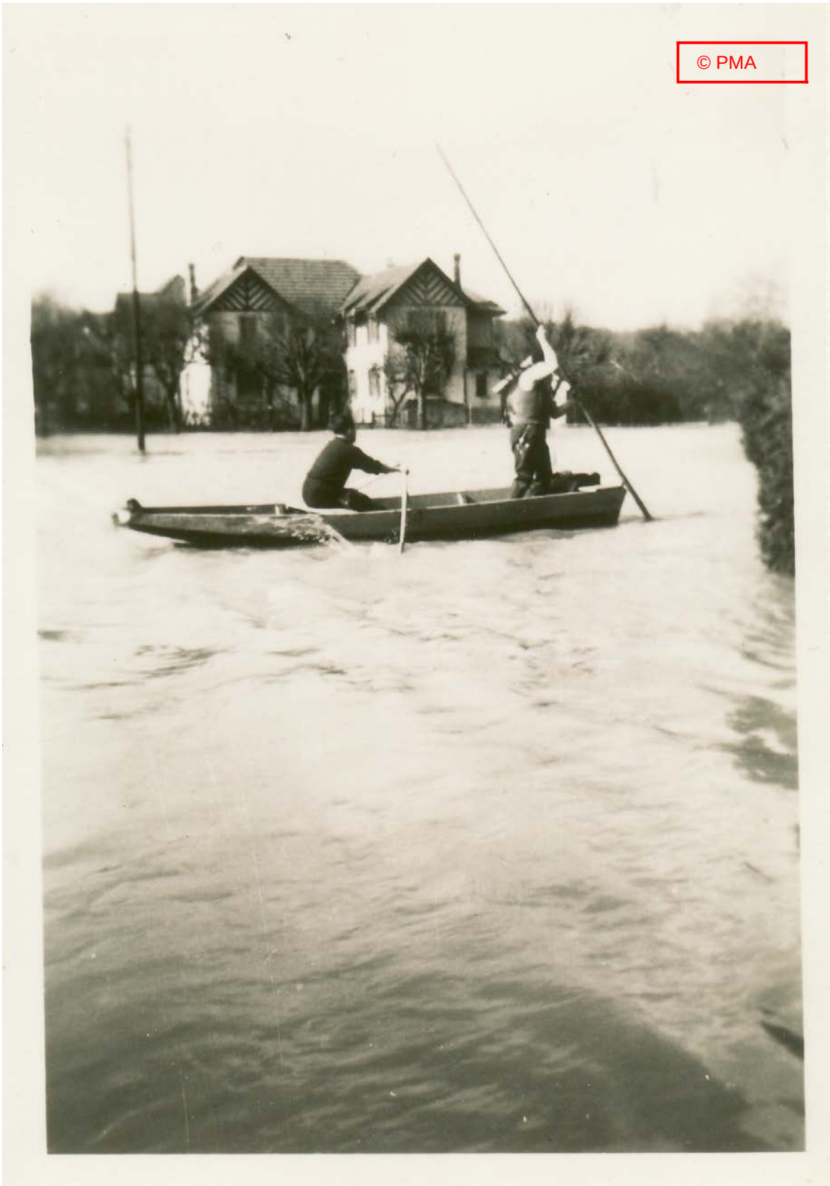
« Les Longines »