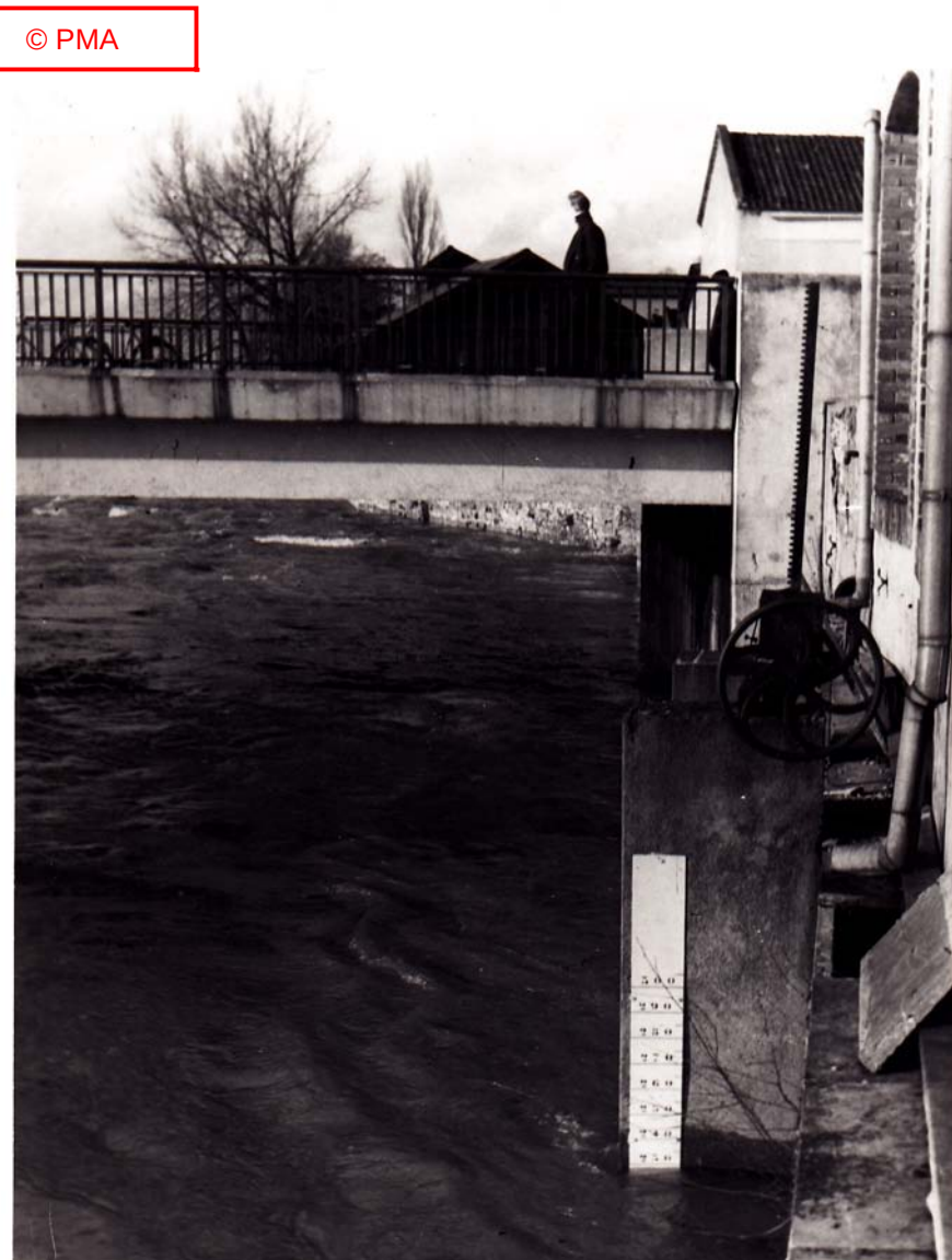
« Sortie de l'usine »