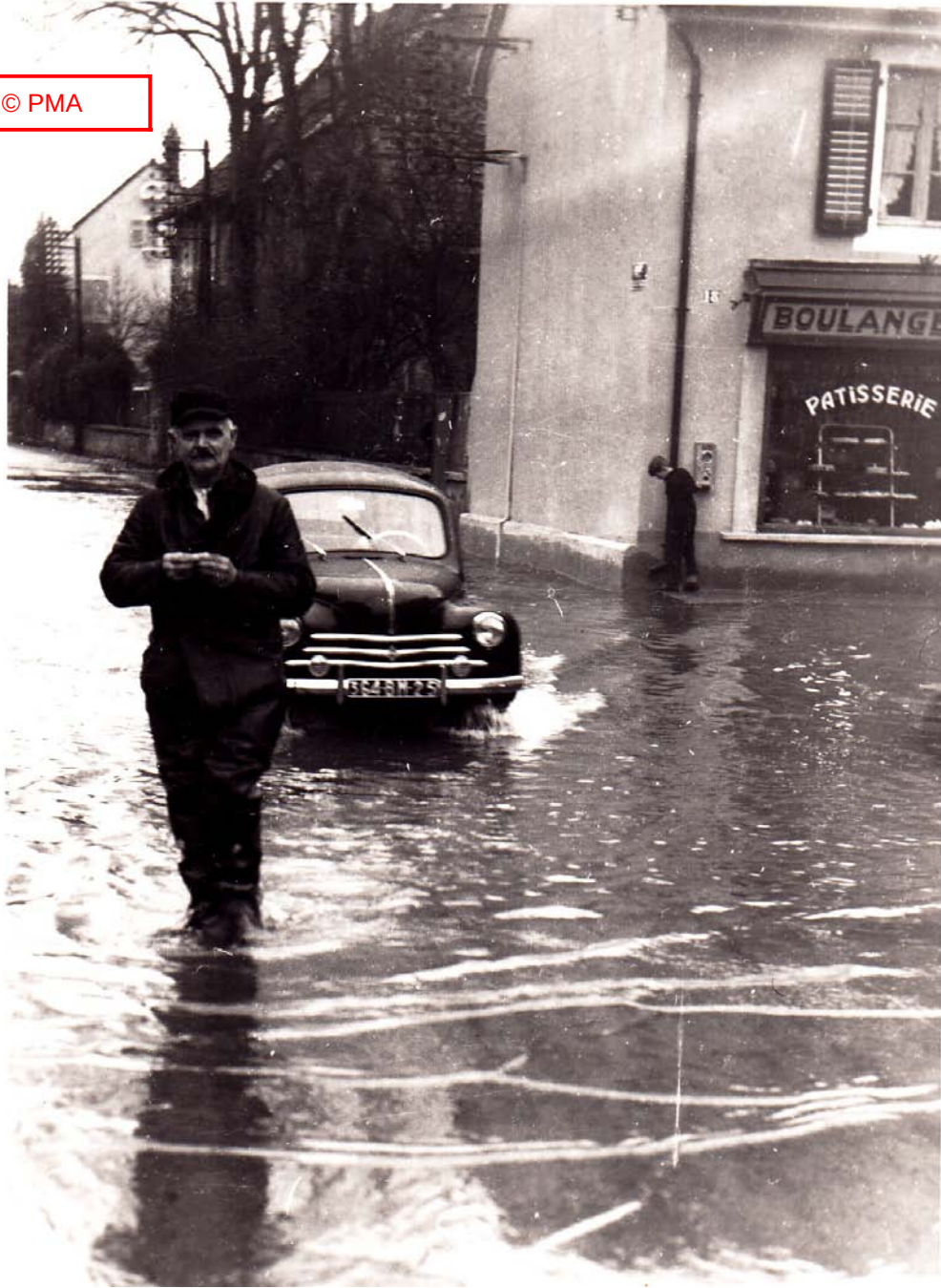
« Entrée rue Villedieu »