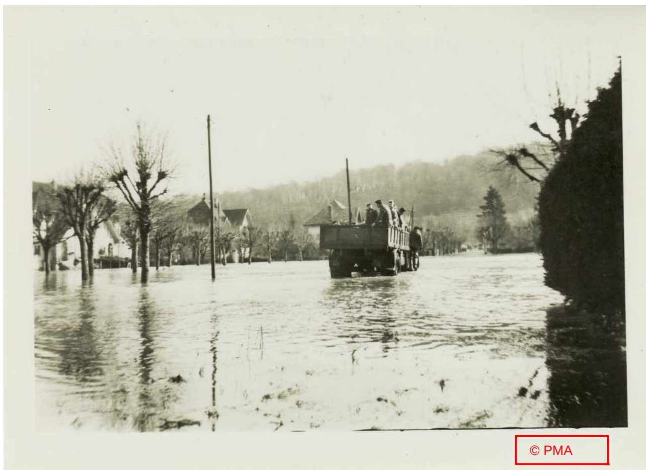
« La place des Longines »