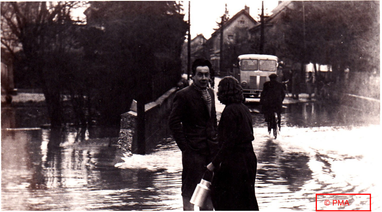
« Rue des Gravieres »