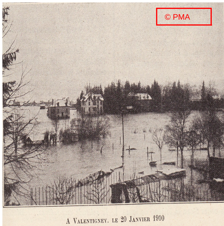
« Rue Villedieu vue depuis la route d'Audincourt »