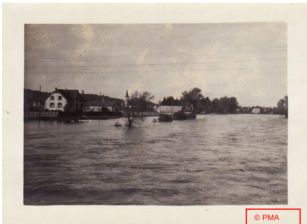
« Rue Villedieu »