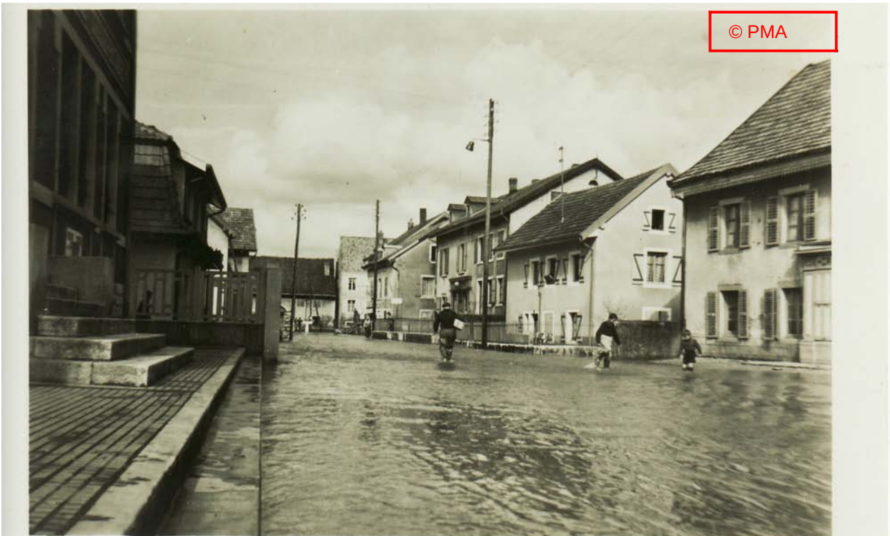
« Rue Villedieu »