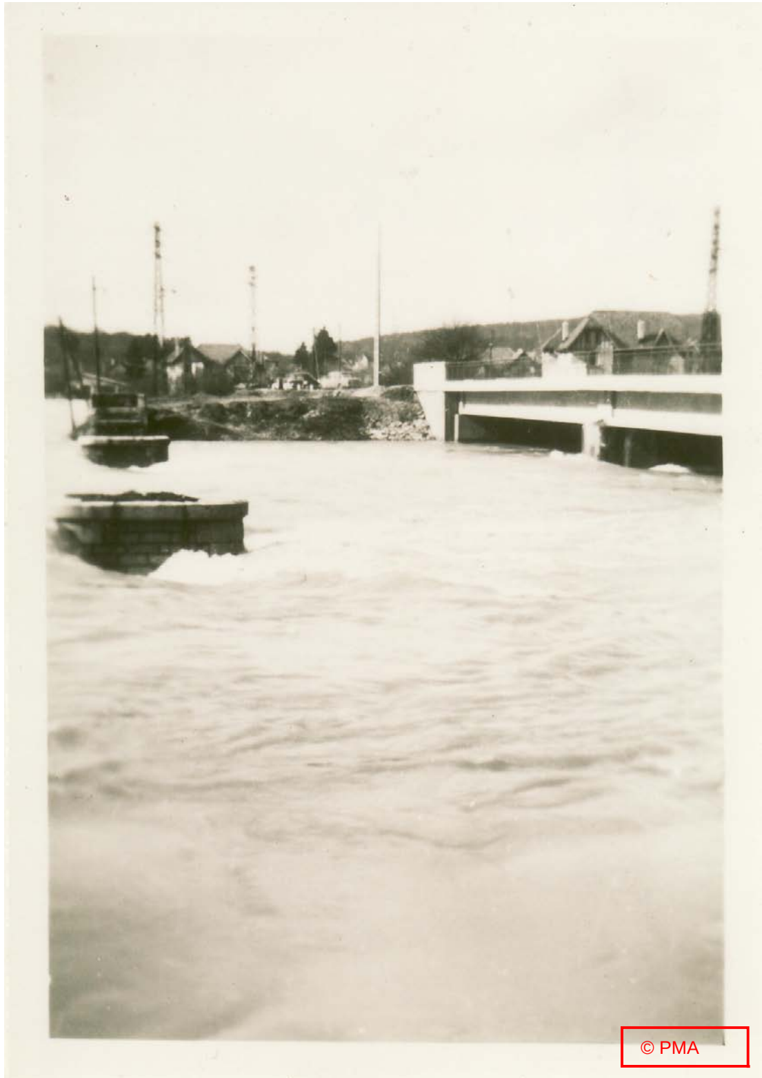
« Le pont de Beaulieu »