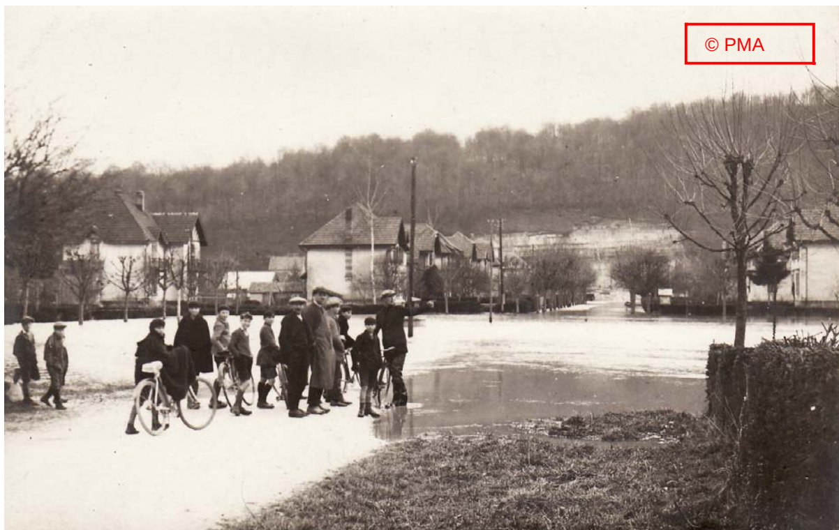
« La place des Longines »