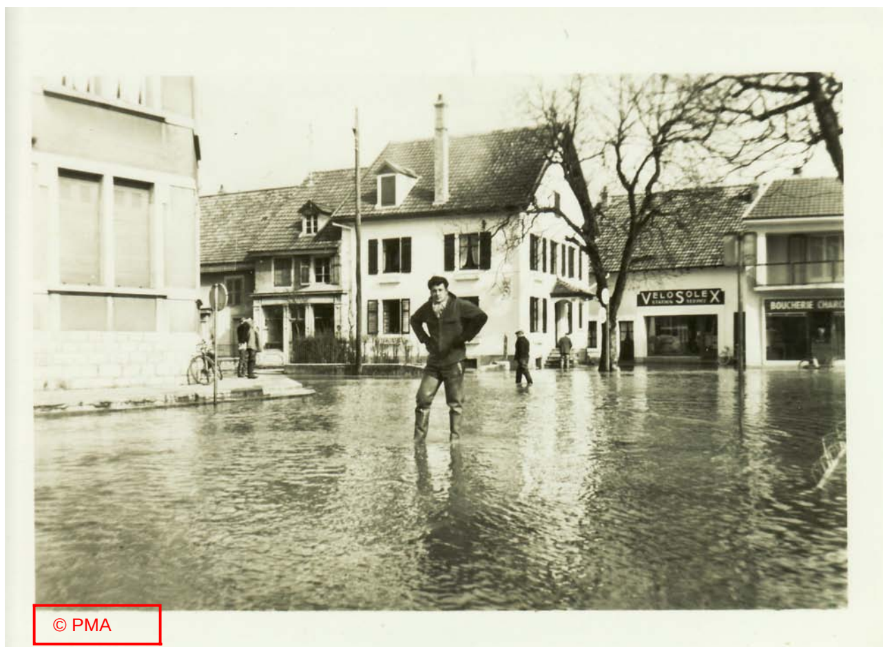
« Place devant la mairie »