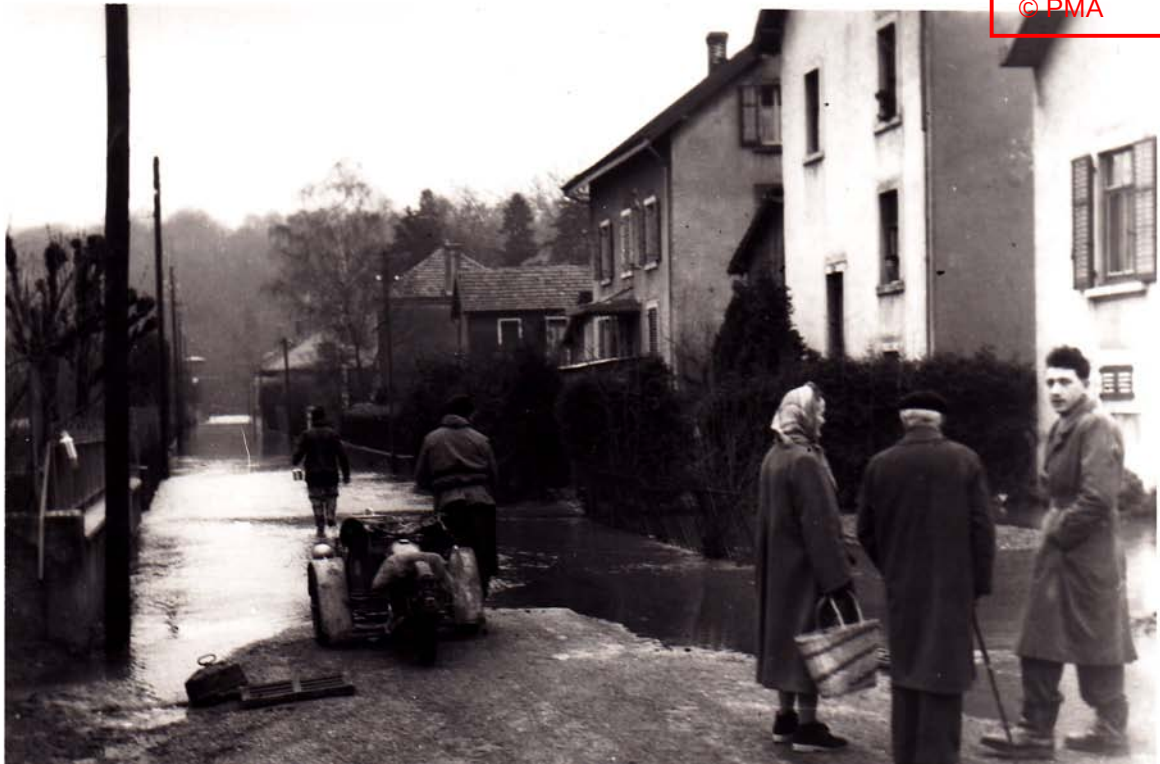
« Rue Pasteur »