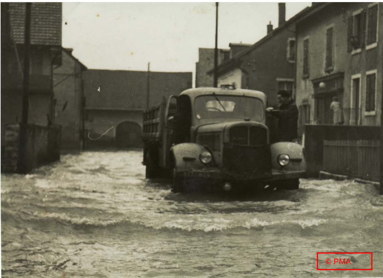
« Rue Villedieu »