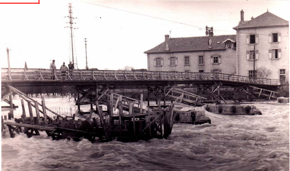
« Pont vers les pompiers »