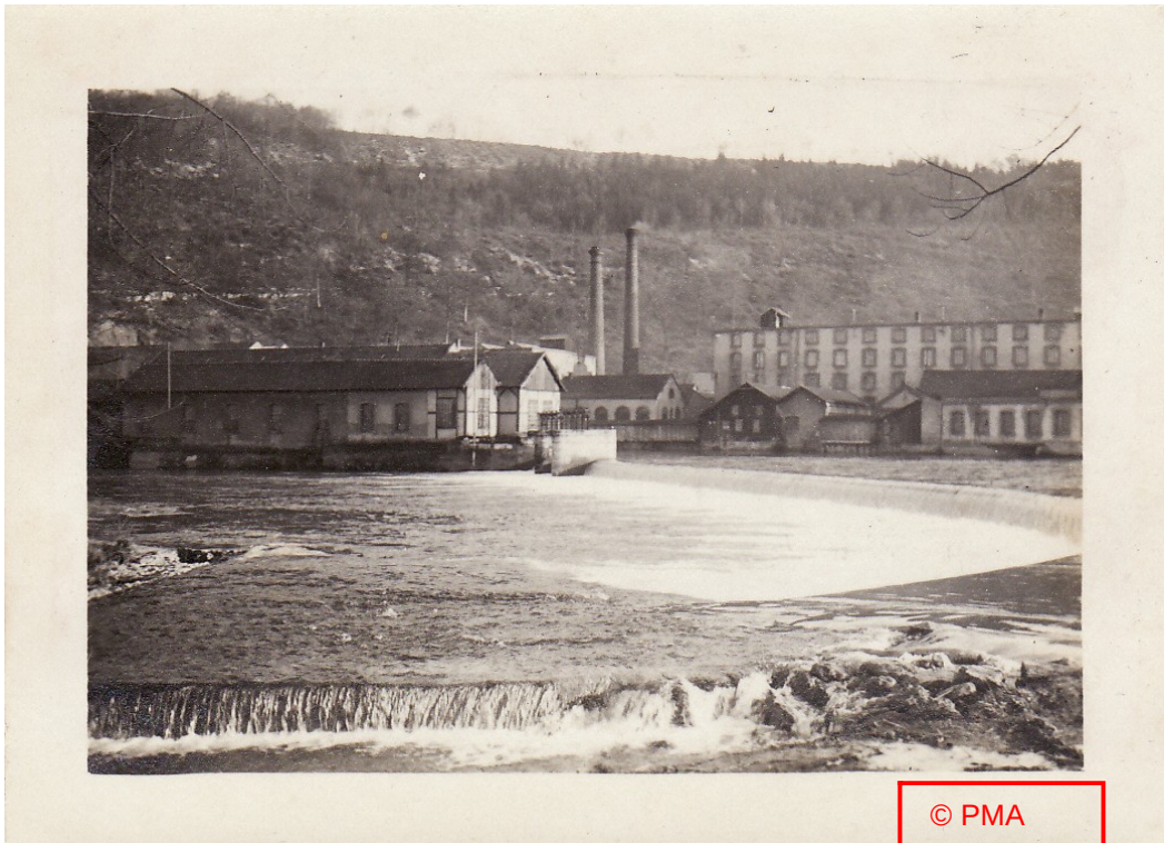
« La passerelle des Longines »