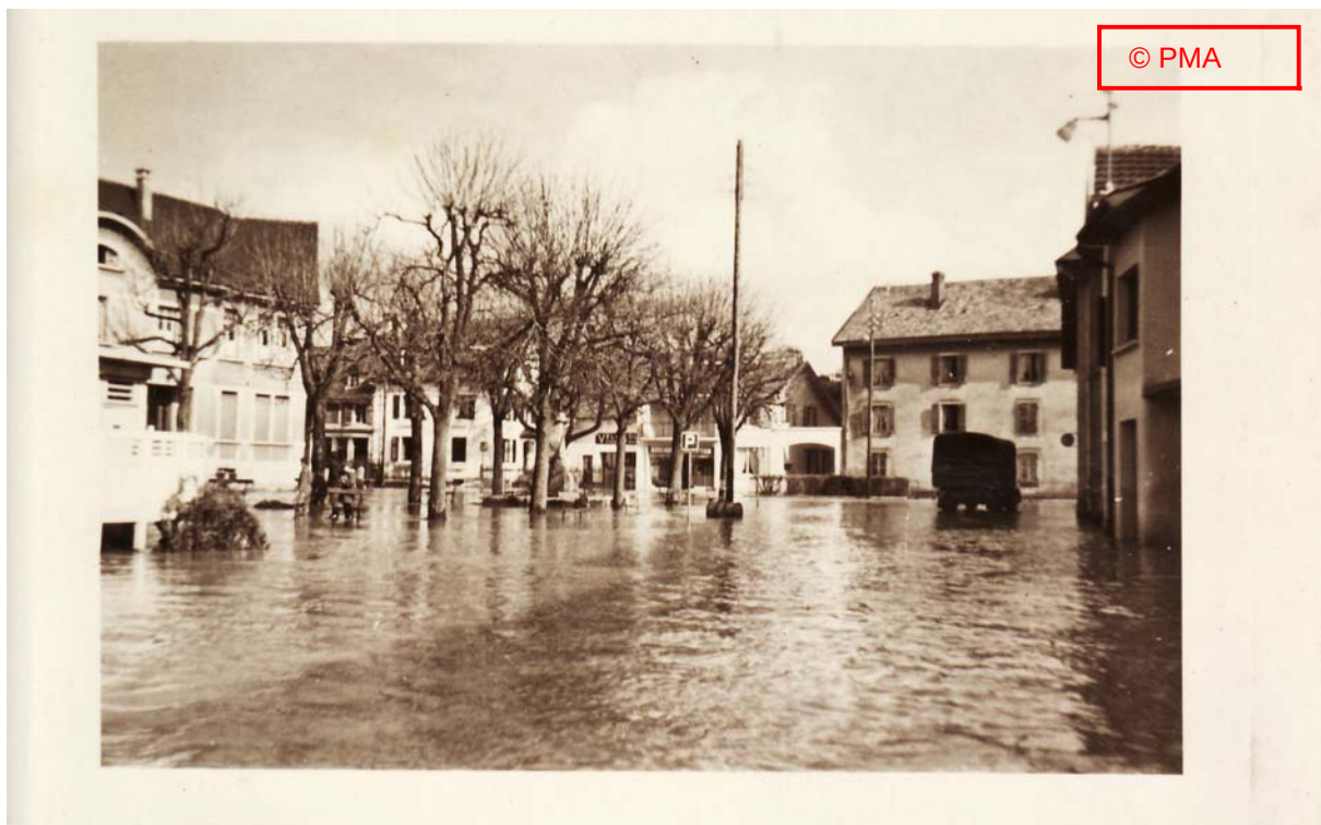
« Place Emile Peugeot »