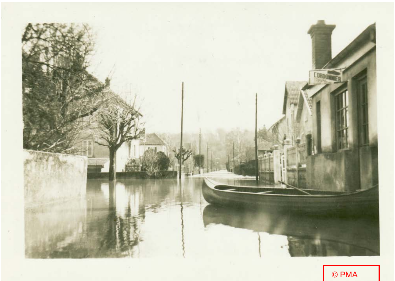
« Rue Pasteur »