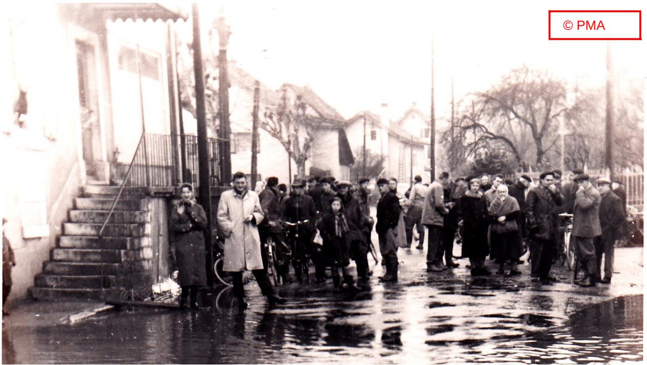
« Carrefour entre la rue Cuvier et la Grande Rue »