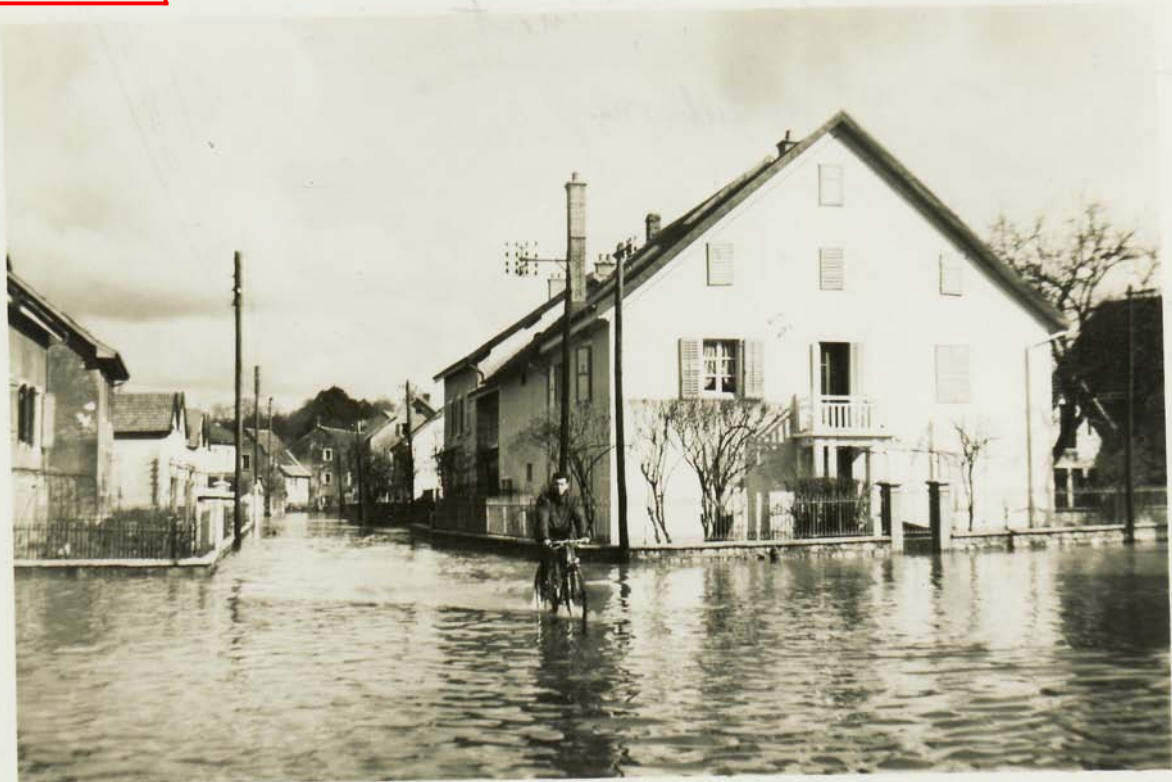
« Rue Carnot »