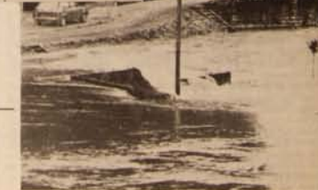
Vers les jardins Philippe