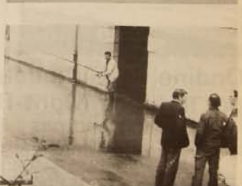
Le moral en toute circonstance (rue d'Azans)