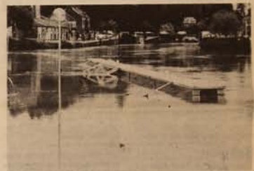
Un ponton perdu en mer