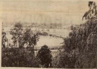
Vue du faubourg de Chalons