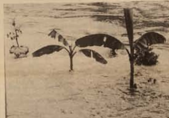
Au bord du canal des Tanneurs