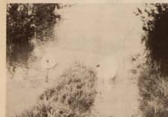
Les bords du Doubs