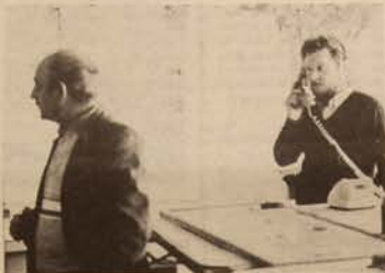
Le P.C. de vigilance

Si le Doubs atteint 4 m et la Loue 1,50 m en ces points, le préfet, le sous-préfet, l'équipement, la gendarmerie et les maires des communes non-dables sont prévenus. Si les cotes atteignent respectivement 6 m et 2,20 m, le sous-préfet décide la mise en place d'un PC-ORSEC inondations, sur proposition de l'ingénieur d'arrondissement de l'équipement. Dès lors, sous l'autorité du sous-préfet, chacun assume sa mission : les maires, informés par télégramme de l'évolution de la situation, ren-