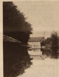
Rue de Longwy à Chaussin