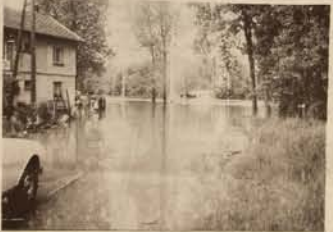
La route à Gevry