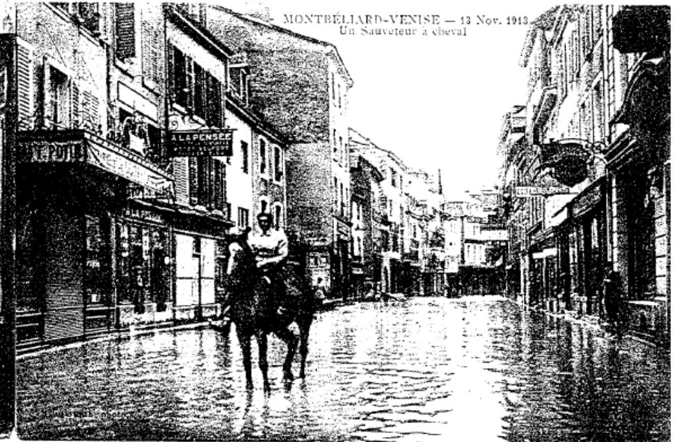
MONTBÉLIARD-VENISE — 13 Nov. 1913 Un Sauveteur à cheval