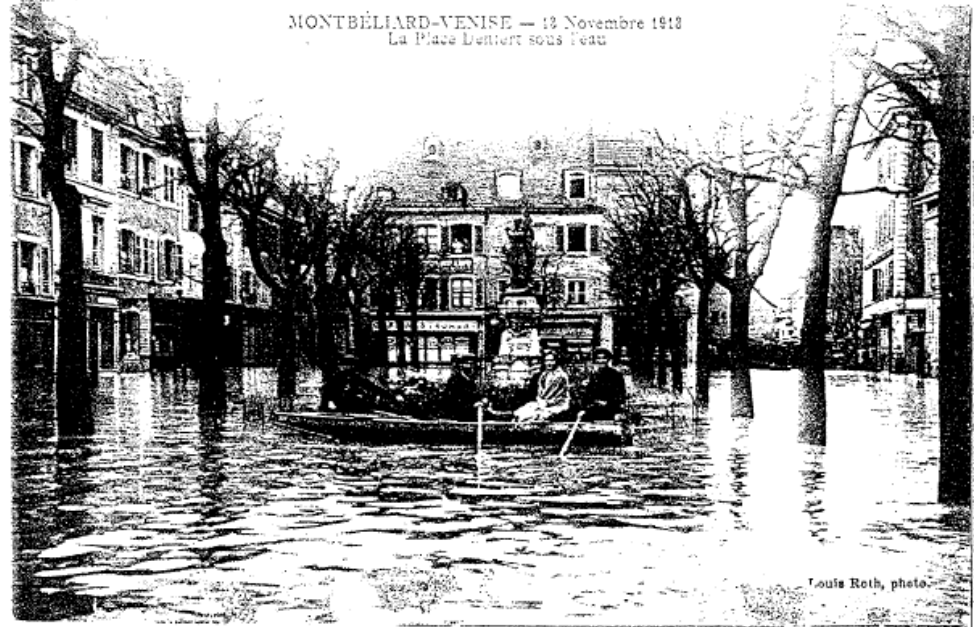
MONTBÉLIARD-VENISE — 13 Novembre 1913 La Place d'Armes sous l'eau