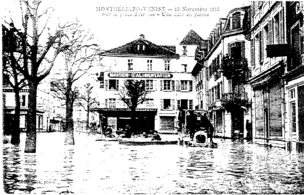
MONTBÉLIARD-VENISE — 13 Novembre 1913 Sur la place d'Armes — Une auto en panne