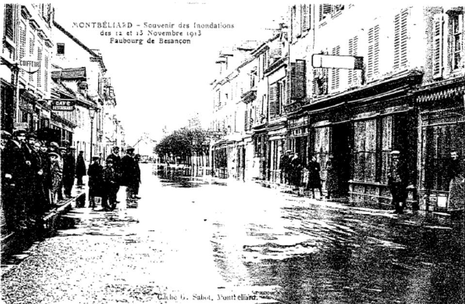
MONTBÉLIARD — Souvenir des Inondations des 12 et 13 Novembre 1913 Faubourg de Besançon