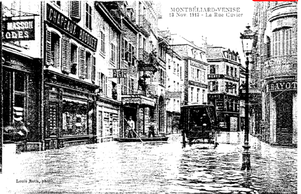
MONTBÉLIARD-VENISE 13 Nov. 1913 - La Rue Cuvier