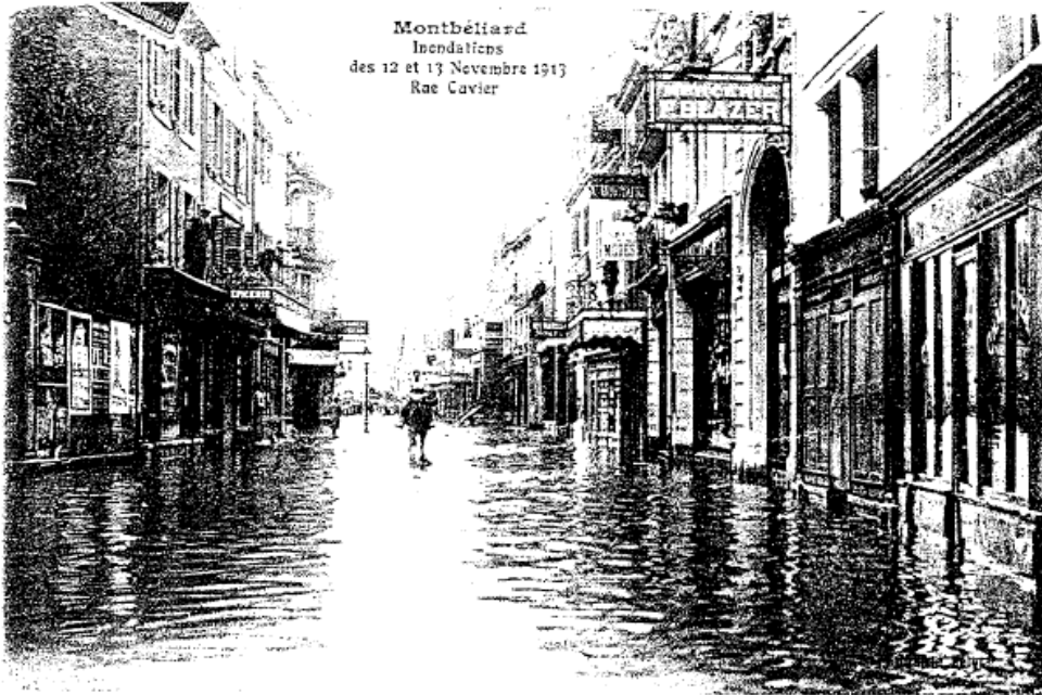
Montbéliard Inondations des 12 et 13 Novembre 1913 Rue Cuvier