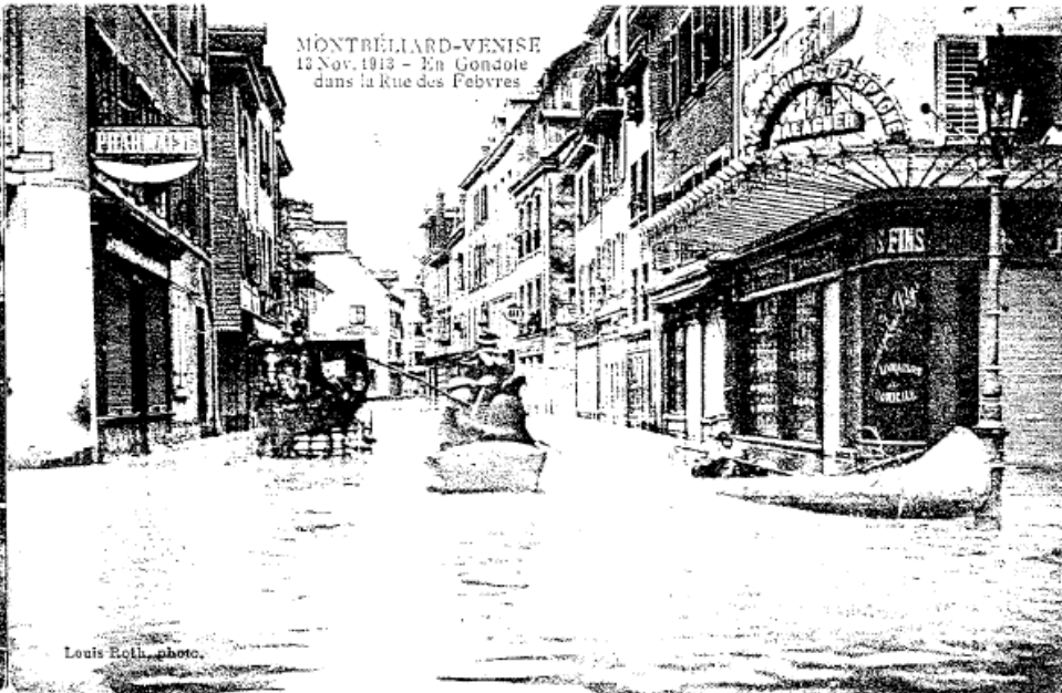
MONTBÉLIARD-VENISE 13 Nov. 1913 — En Gondole dans la Rue des Febvres