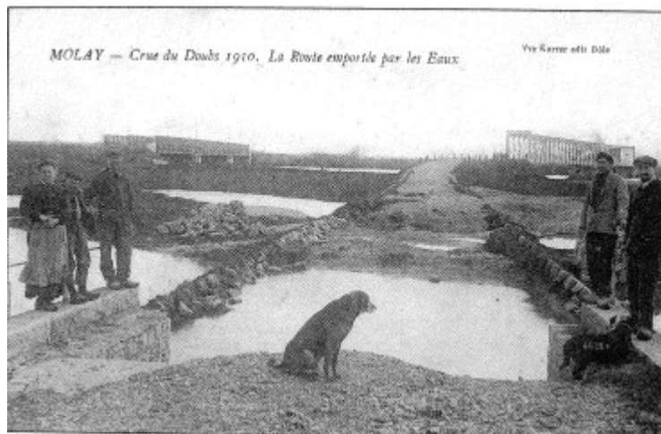
La route emportée par les eaux