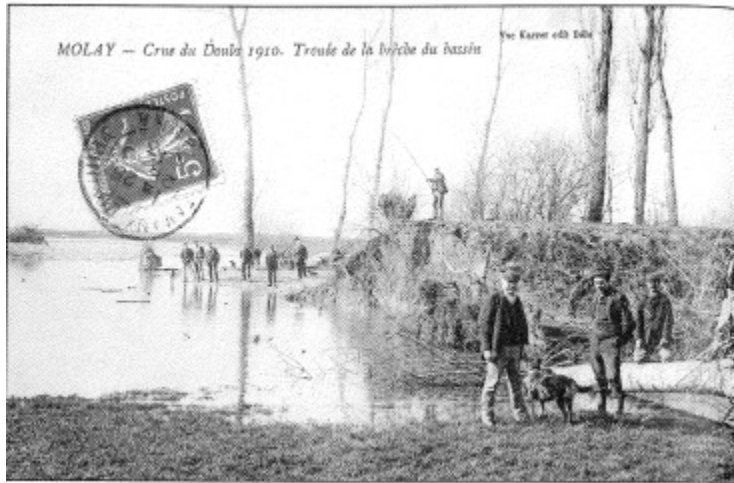
Trouée de la brèche du bassin