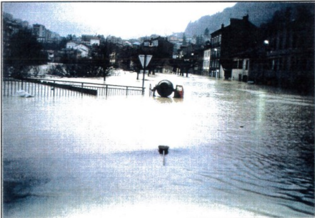
La place des Serves