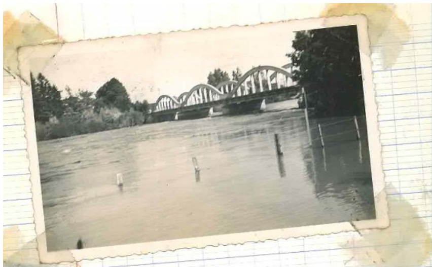
La cote à la règle du pont " à arches " située coté Hotel ST HUBERT est à 3,40 m. Il y a encore du passage sous le tablier du pont, mais la haute d'eau et sa vitesse sont spectaculaires.