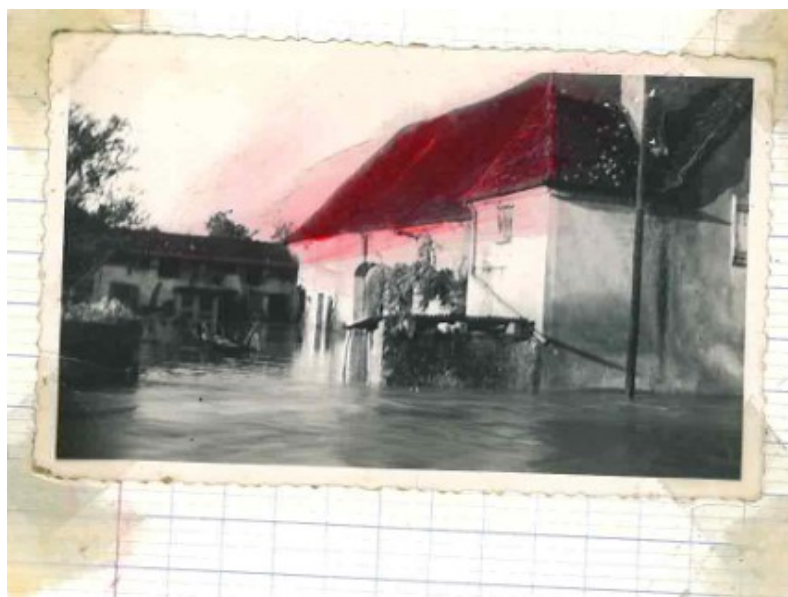
L'eau atteignait la table de cuisine dans la maison CALINON