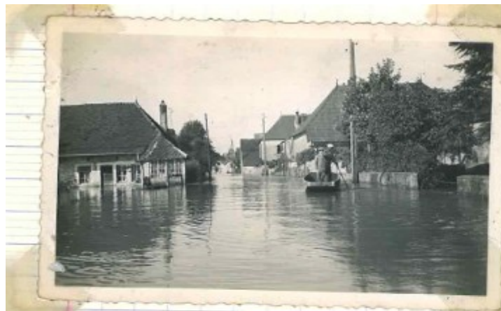
Rue de la Gare ou rue des Tabarys . On reconnaît sur la barque et en deuxième posi René LANCE. La circulation est aisée "en barque" Remarquez la hauteur d'eau sur les murs d'entr à la maison de Mme RICHARDET.