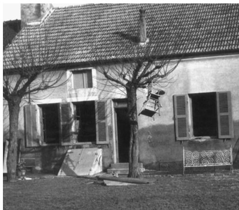
Maison à Verjux (71) après la crue

La zone la plus touchée est certainement la confluence de la Saône et du Doubs : avec la rupture de la digue à Verjux, le village est évacué. Le pont qui permettait autrefois de rejoindre Gergy et qui franchissait la ligne de démarcation pendant la guerre avait été bombardé puis dynamité par les armées en retraite. Les bas quartiers de plusieurs communes aux alentours sont également touchés (Verdun, Allerey, Saunières, Ecuelles...). Dans certaines maisons, l'eau atteint 2.50 m. En tout dans cette zone, plus de 800 foyers et 2 700 personnes sont touchées.