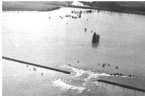
Rupture de la digue de Verjux

L'expansion de la crue dans le lit majeur entre Mâcon et Lyon, ainsi que l'absence de crue significative sur les affluents en aval a permis d'atténuer son impact vers l'aval.