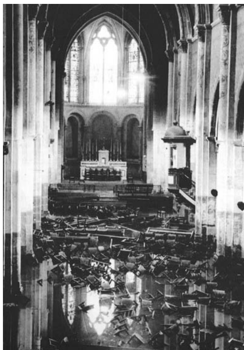
Église de Belleville (69)

Plusieurs quartiers de l'agglomération lyonnaise sont cernés, plus de quarante foyers sont isolés. Sur la seule commune de Fontaines-sur-Saône, les dégâts sont estimés à plus de 10 Millions de francs de l'époque. On déplorera un mort en région lyonnaise, également touchée par la crue du Rhône. A Vaulx-en-Velin la digue de protection du Rhône cède. A St Fons une maison s'effondre et 300 personnes sont sinistrées.