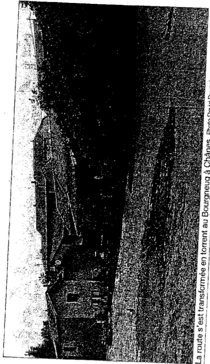
La route s'est transformée en torrent au Bourgneuf à Chânes.

Bloqués. Trente voisins qui faisaient une fête de quartier ont été bloqués dans une cour, au Bourgneuf, à Chânes.