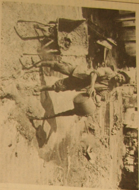
Des seurs de boue qu'il a fallu déverser toute la journée...