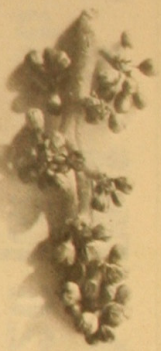
C'était une grappe de vaine-romannée