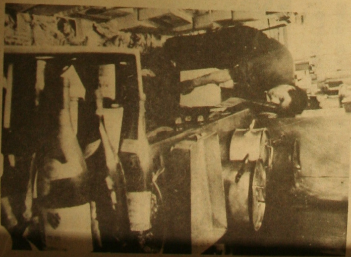
La cuisine de la « Petite Auberge » : Les bouteilles s'en alignent à la dérive...