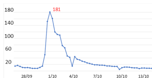
Hydrogramme de la crue de l'Ouche sur la commune de Velars-sur-Ouche, au niveau de la rue des Trois-Ponts (DDT de Côte-d'Or)

Le 30 septembre un débit de 186 m 3 /s a été mesuré sur la Vouge au niveau d'Esbarres. Ce débit correspond à une période de retour de crue largement supérieure à 100 ans. La crue de la Saône a empêché le bon écoulement des eaux de la Vouge ce qui a aggravé les inondations.