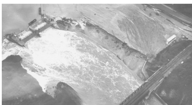
Vue générale du barrage et de la brèche du lac Kir