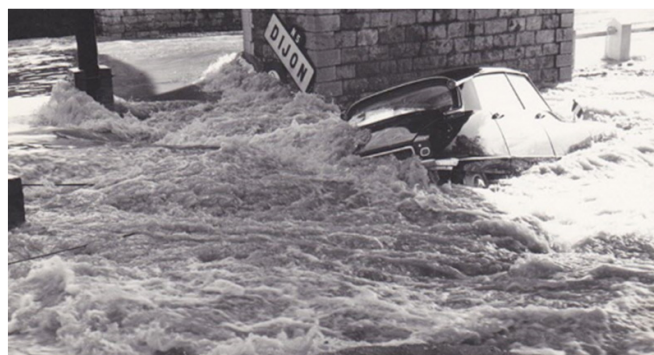
La voiture du maire de Dijon est piégée par les eaux sous le pont d'Epinac