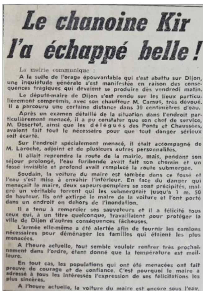
Article de presse, lors de la venue du maire de Dijon pour constater les dégâts des inondations.

* Les dégâts présentés ne sont pas exhaustifs