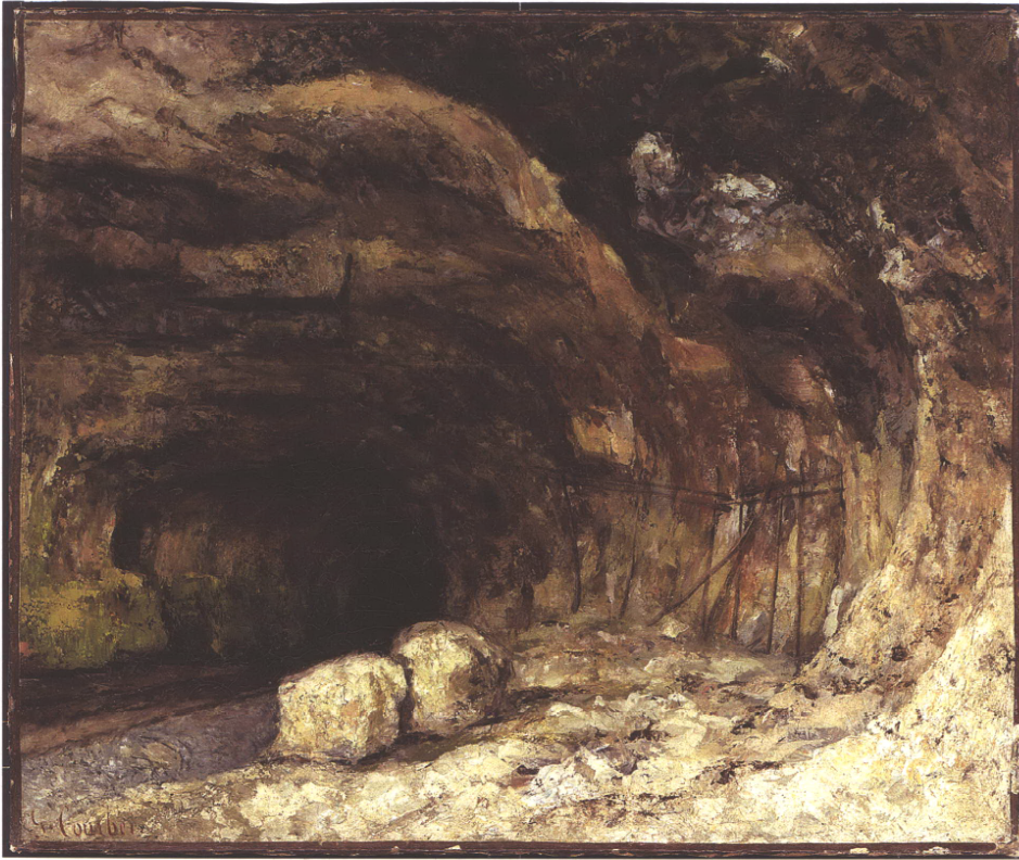
Figure 2: Gustave Courbet, La Grotte Sarrazine, 1864, 54 x 65 cm (Los Angeles, The J. Paul Getty Museum). The Saracen cave.

matière, le calcaire qui le fascine, l'écume des vagues de la Manche à Etretat ou la lumière de la Méditerranée à Palavas, la sylve comme théâtre de la chasse dont l'Orée de la forêt (1856) qu'il fond en une même substance chromatique végétaux et minéraux verts, rouges et noirs.