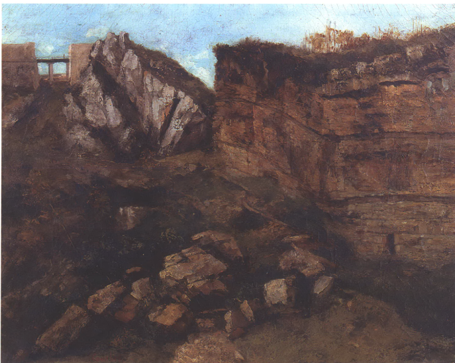
Figure 1: Gustave Courbet, La Roche pourrie, étude géologique, 1864, 59,7 x 73 cm (coll. Musée Max Claudet, Salins-les-Bains). The rotten rock, geologic study.

Les cent vingt toiles exposées au Grand-Palais – avec soixante photographies de Le Gray, Le Secq et Davanne – font voir le monde qui prend possession de l'art. Au diable les mythes et l'Histoire, la beauté idéale et les poses! Ici, les humains sont tels que Courbet les dévisage, les paysages tels qu'ils s'imposent, la Loue qui sourd apaisée de sa résurgence n'est pas mise en scène. Courbet est plus qu'un peintre de paysage. C'est un chercheur de la