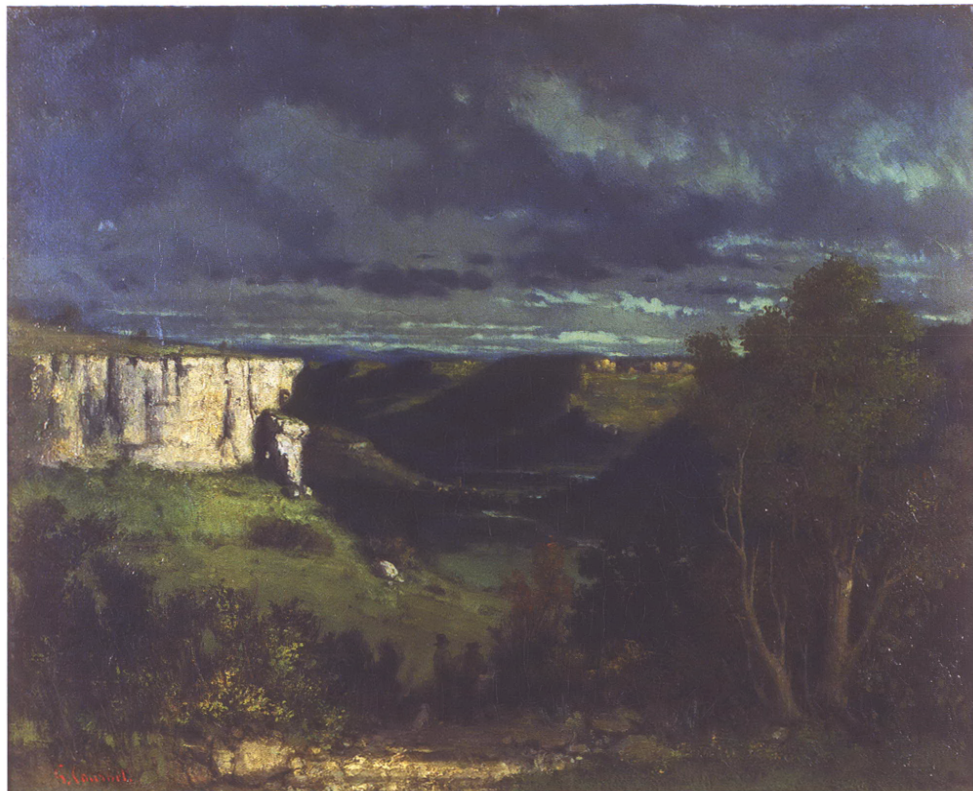
Figure 4 : Gustave Courbet, La vallée de la Loue par temps d'orage, vers 1849, 54 x 65 cm (Strasbourg, musée des Beaux-Arts). The Loue valley in a stormy weather.

Avec près des deux tiers de ses toiles dans le genre paysager, Courbet est une référence essentielle de notre histoire du regard sur le monde entre Delacroix et les Impressionnistes. Peintre de la mer à Montpellier et en Normandie, de la forêt à Fontainebleau et en Saintonge, c'est surtout un peintre du terroir franc-comtois, d'un tout petit périmètre sur le deuxième plateau jurassien entaillé par la Loue et le Lison. Bien que Parisien pour l'essentiel de sa vie, Courbet n'a pas peint la capitale. Il revenait souvent chercher un motif autobiographique dans la géologie de son pays qui le fascinait (figure 3). Il y percevait une singularité qui nourrissait sa soif d'indépendance et de liberté. Puisant chez Corot les premières touches de lumière, il dévoile tôt une veine naturaliste nordique après ses visites à Fontainebleau à l'âge de 22 ans. Il donne,