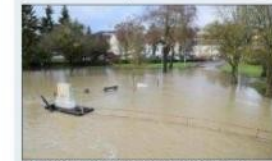
■ La promenade de l'Ouche impraticable à Dijon.

À Dijon, l'Ouche est sortie de son lit, inondant la promenade de l'Ouche vers le Lac Kir et les infrastructures du camping, toujours fermé pour cause de travaux. Des panneaux "route barrée", interdisant la circulation aux piétons, ont été placés à proximité du pont de l'avenue du Chamoine-Kir. À la sortie de Bessey-sur-Tille, en direction de Chevigny-Saint-Sauveur, la route était à moitié inondée. La circulation se faisait de façon alternée, avec des feux tricolores. Les inondations n'ont pas épargné Ars-sur-Tille non plus. « L'eau monte très vite sur des sols saturés. La zone de pluie est très étendue en amont. Le point le plus haut est à venir dans les prochains jours », s'inquiétait le maire, Patrick Morelère.