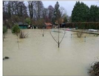
À Montbard, au quartier Saint-Roch, les jardins des particuliers sont totalement inondés.