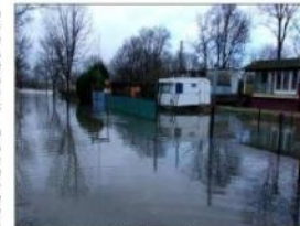
■ Le camping de Lecklélet inondé.

Le premier édile se rend au moins deux fois par jour aux deux extrémités de son village de 420 âmes pour surveiller les habitations un peu éloignées. « Il n'y a pas le feu au lac. Je suis né dans la commune et j'ai connu des années où l'eau rentrait à l'intérieur du village. On a même fait des élections en cuisines et en barques. » Entre Chives et Seurre, la Saône a envahi les champs et coupé la RD 12. Elle devait encore monter mardi. « La