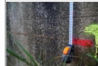
Levé EPTB S&D 6 et 7 mars 2018