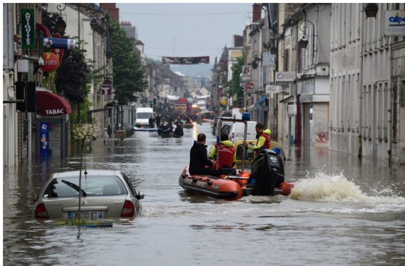
Photo Nemours 2016